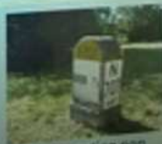
Intervention non programmée